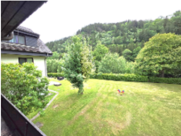
Dürrstein ETW Top 3, OG 1 mH 81,80 m 2 ogL 7,70 m 2 Loggia